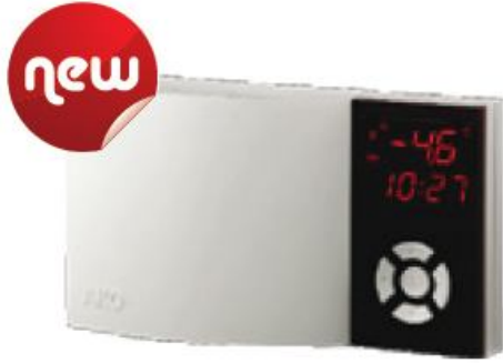
AKO-15724 / AKO-15725

"2" Inputlu Sıcaklık, Nem veya Dijital Input Kayıt Cihazı